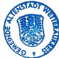
-Dominic Imhof- Gemeindewahlleiter