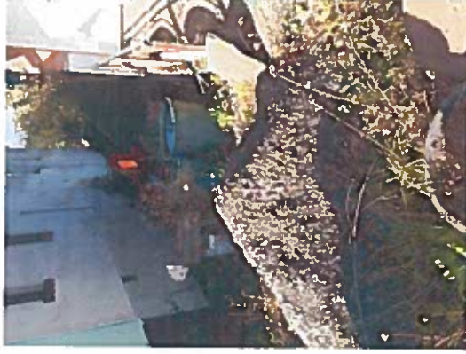
Stockheimer Straße Nr. 110

Bei dem Grundstück handelt es sich um ein unbewohntes Haus mit anliegenden Garten. Es wäre zu klären ob es rechtliche Mittel gibt, dass der Eigentümer sein Grundstück in Ordnung hält.