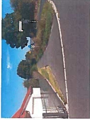
Weg Ortsausgang Richtung Glauberg

Am Vulkanradwege Höhe Spielplatz und am Weg Höhe Ausfahrt Zum alten Bahnhof / Stockheimer Straße sollte jeweils eine Hundetoilette angebracht werden.