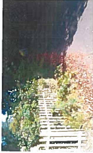
Zaun des Vereinsheims

Erneuerung des Zaunes zwischen Grundstück und Vulkanradweg. Der Verein der Freiwilligen Feuerwehr Enzheim ist bereit den Zaun selbst fachgerecht zu montieren. Sinnvollerweise sollte es der gleiche Zaun sein, wie er am benachbarten Spielplatz verwendet wurde (Doppelstabmattenzaun). Das Material für den Zaun sollte von der Gemeinde als Eigentümer des Geländes bereitgestellt werden. Fragen zu Material und Anlieferung sind direkt mit der Freiwilligen Feuerwehr Enzheim zu klären.