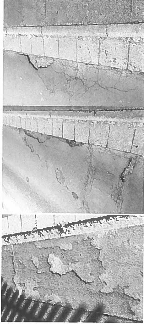
Straßenschäden in der Stockheimer Straße

Der Straßenbelag der Straße ist an mehreren Stellen gerissen. Die Bordsteine sind heruntergefahren. Die Bürgersteige sind ebenfalls kaputt. Die Straße ist in einem sehr schlechten Zustand. Diese Schäden sollten möglichst bald behoben werden. Eine Erneuerung der Straße ist sinnvoll.