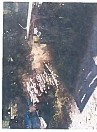
Grundstück Höhe Friedhof