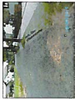
Foto: Blick von Straße vor Haus Nr. 1 Richtung Zum Kerlesgrund