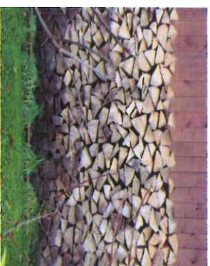
Beispiel einer schlechten Lagerung